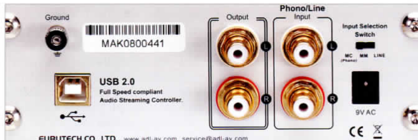
Alles dran: Mehr Anschlüsse braucht's nicht für eine komplette Vorstufe

Für den Praxistest verbinde ich also zunächst mal den Furutech ADL GT 40 per USB-Kabel mit meinem Mac. Binnen weniger Sekunden erscheint sein Eintrag im Ton-Menü, und auch im Setup für Audio & Midi kann ich ein- wie ausgangsseitig problemlos alle Sampling-Frequenzen zwischen